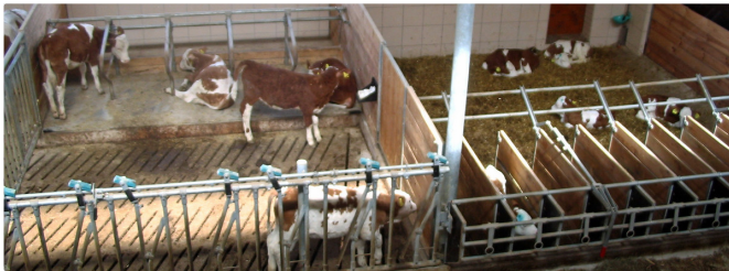
Kuhstall 2 (02.11.2016,)

Davor kurz auf Gras links hinunter, gleich wieder rechts und am Ufer entlang bis vor dem nächsten, noch nicht sichtbaren Weiher, dort rechts. Im Linksbogen leicht aufwärts am Zaun entlang, rückt nach einer Passage am Waldrand und dem x-ten Weiher unser nächstes Ziel, das 469 m hoch gelegene Dorf Mäbenberg - von den Einheimischen „Mamberch“ genannt -, ins Blickfeld. Am Trafohäuschen weiter nach oben und in der Konrad-von-Megenberg-Straße rechts, geht es in der „Krummen Leite“ schon ausgeschildert hinauf zum Kuhstallcafé (km 6,0).