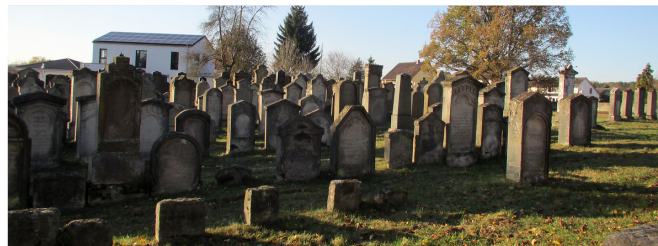
Judenfriedhof 2 (02.11.2016,)

Nahezu stets geradeaus auf dem grob geschotterten Weg, dann über eine Landstraße, es geht auf einer alten Teerstraße weiter bis zu einer Gabelung. Im Linksbogen aber weiter „der Nase nach“ entlang einer Lichtung, dann wieder durch ein Waldstück und freie Flur links des Weges. Im folgenden Mischwald steigt der Weg noch einmal kurz an. Nach einer geraden Abwärtspassage sind dann die ersten Häuser von Georgensgmünd am Ende des Abendberger Weges erreicht (km 11,2).